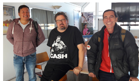
2018 : adoption de la création de la Maison Culturelle à la mairie d'Aasiaat