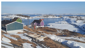
Акуннаак - Groenland