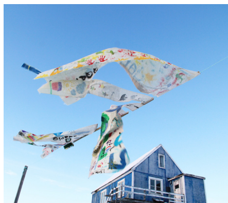
Installation ANORI : Oijha (résidence Artistes en Arctique 2018)

En 2019, avec le soutien des habitants du village d'Акуннаак et de la Communauté de Communes de Qeqertalik (Aasiaat), l'association remet en état une maison communale du village, qui devient la Maison Culturelle d'Акуннаак.