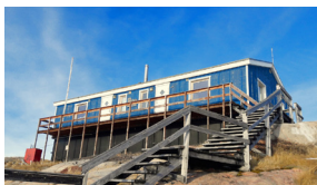
Maison culturelle d'Акуннаак