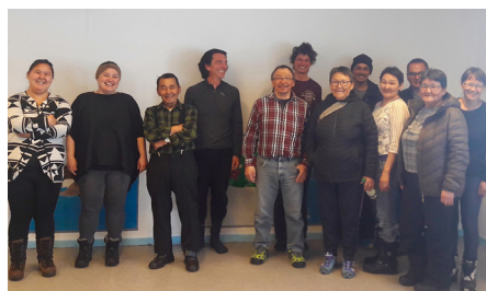
Comité de création de la Maison Culturelle